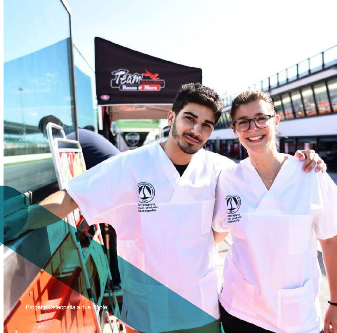
Progetto Osteopatia a due Photo.

Tali attività sono propedeutiche alla pianificazione e stesura di un articolo scientifico , condotto con la supervisione del Dipartimento di Ricerca di EOM Italia.