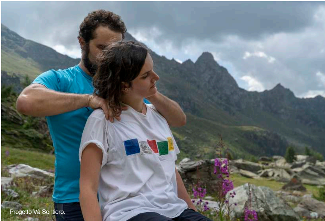
Progetto Vá Sentiero.

Il conseguimento del titolo comporta l'acquisizione di 142 Crediti Formativi Universitari (CFU).