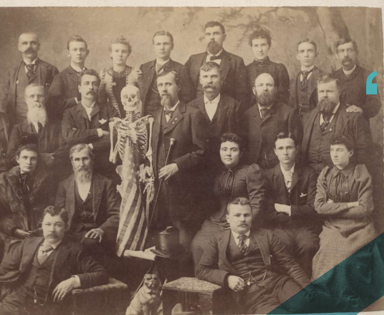
Museum of Osteopathic Medicine, Kirksville, Missouri [2007.09.01]

“ An osteopath is only a human engineer, who should understand all the laws governing his engine and there by master disease. ”